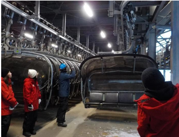
索道機器取扱い実技研修