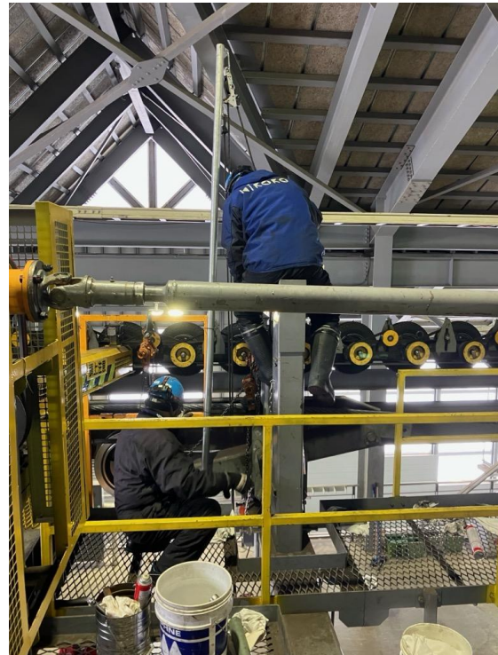
場内押送機械整備