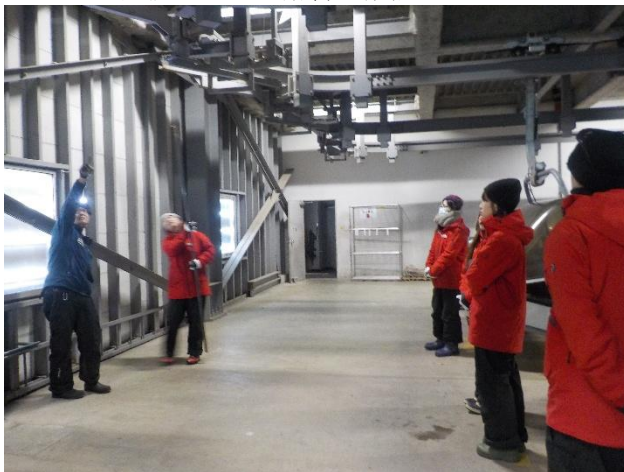
危険ポイント講習・機械説明