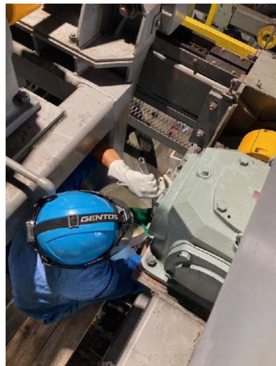
場内押送機械整備