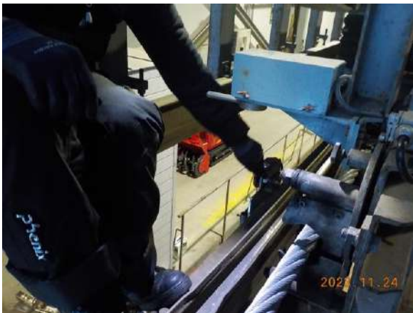
危険ポイント講習・機械説明