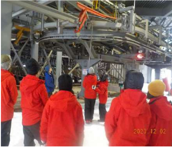
索道機器取扱い実技研修