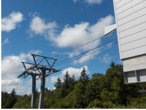
長峰第1エクスプレス通信ケーブル更新