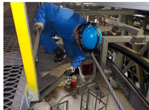
滑車ゴムライナー点検