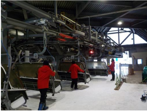
索道機器取扱い実技研修

当社では索道職員に対して、輸送及び職員やお客様への安全に役立つよう、シーズン営業開始前に施設及び機器取扱いについての安全教育を実施致しております。