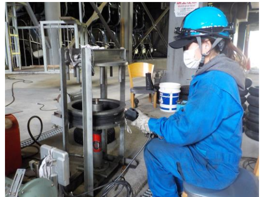
索輪組み換え整備