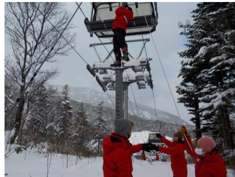
リフト乗客救助訓練