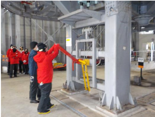
安全確認動作研修