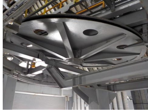
長峰第2エクスプレス滑車ゴムライナー更新