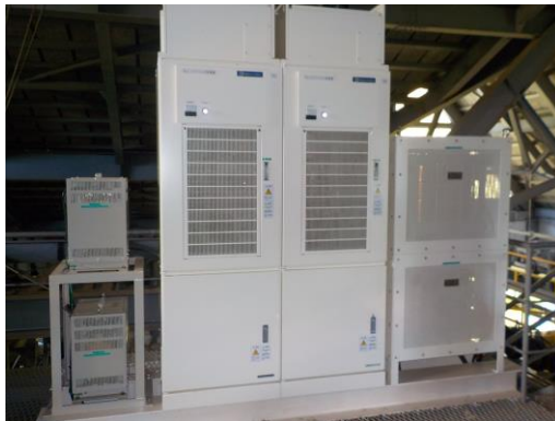
長峰第2 エクスプレス制御盤更新

安全の維持・向上の為、10ヵ年整備計画に基づく年間整備計画にて、今年度においては索道設備の一部更新、諸設備の修繕、消耗部品類の交換等を実施致しました。