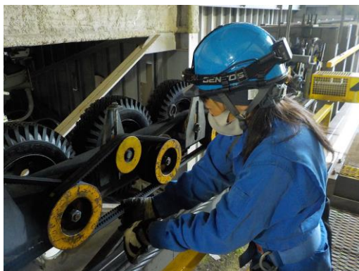
場内機械点検・整備