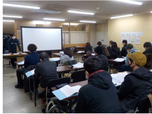
係員業務講習、安全教育（座学）