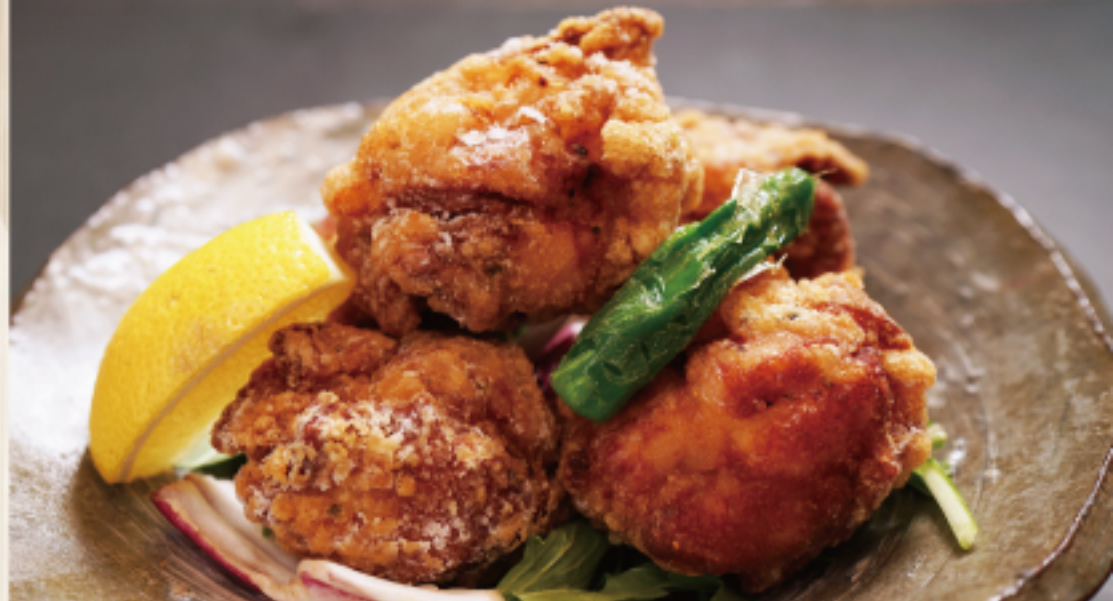
知床鶏ザンギ 980 円 Deep fried chicken