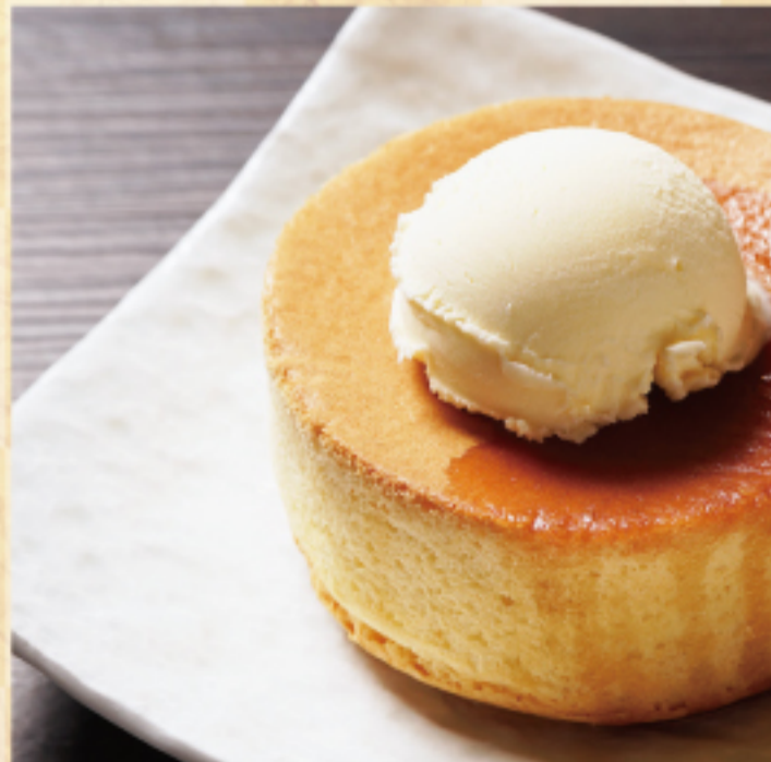
厚焼きスフレパンケーキ Souffle pancake