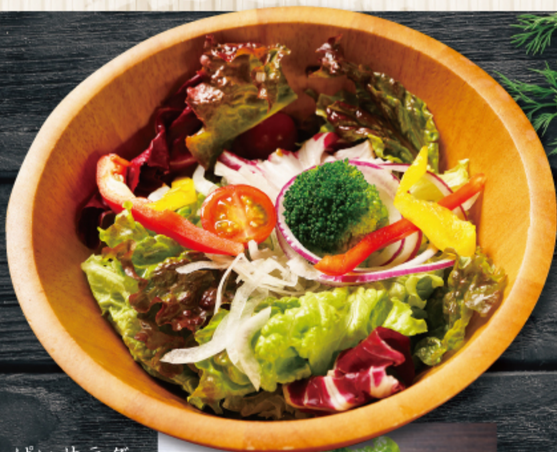
色々野菜のグリーンサラダ Vegetable salad 1,180 円