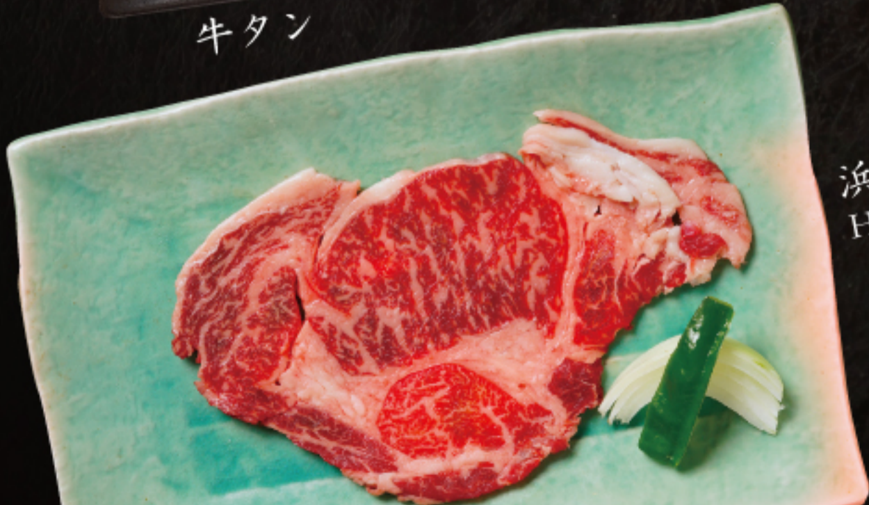
浜中黒牛リブロール Hamanaka beef rib eye roll 4,800 円

価格はサービス料 13%と消費税 10%が含まれております。 Price subject to 13% service charge and 10% government tax.