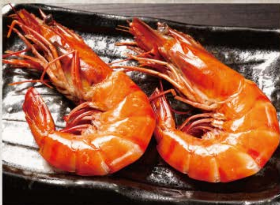
海老 (2尾) 1,880円 Shrimp