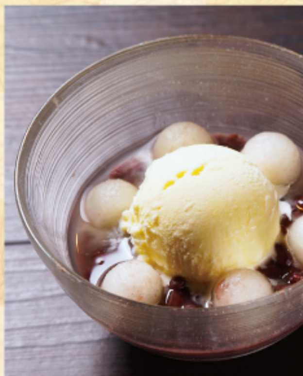
やわらか白玉のクリームぜんざい Zenzai (a sweet soup made of red-beans with Japanese mochi dumplings)