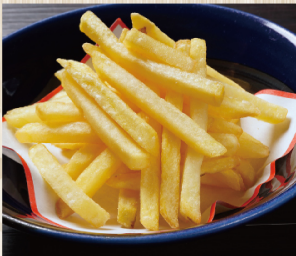
ポテトフライ 680 円 French fries