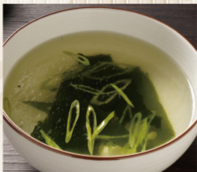
わかめスープ Seaweed soup