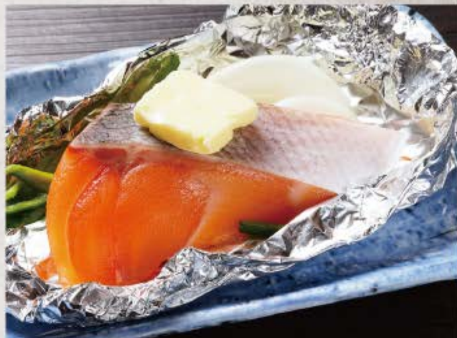
サーモンホイル焼き 800円 Salmon baked in foil

価格はサービス料13%と消費税10%が含まれております。 Price subject to 13% service charge and 10% government tax.