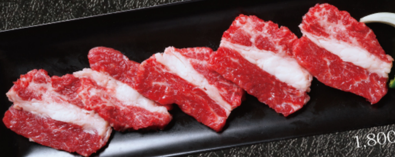
十勝牛 上カルビ (トモバラ) Tokachi beef short plate