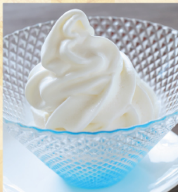
ソフトアイス (バニラ) Soft ice (vanilla)