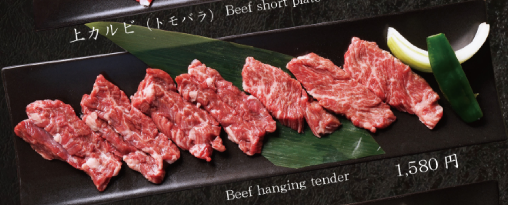
サガリ Beef hanging tender 1,580 円