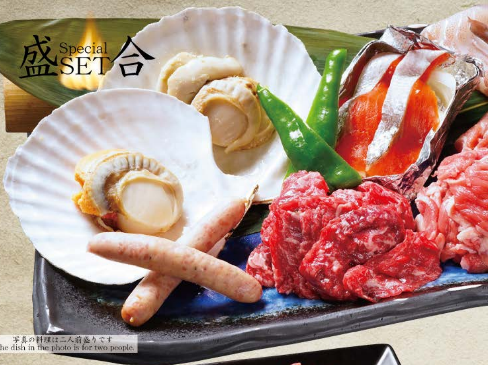
写真の料理は二人前盛りです The dish in the photo is for two people.