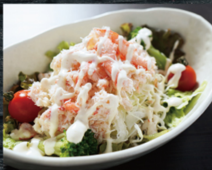
かにいっぱいサラダ Crab salad 1,580 円