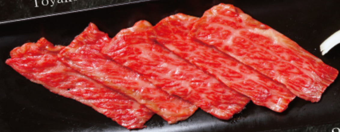
とうや湖和牛 特上カルビ (ザブトン) Toyako Wagyu beef chuck flap