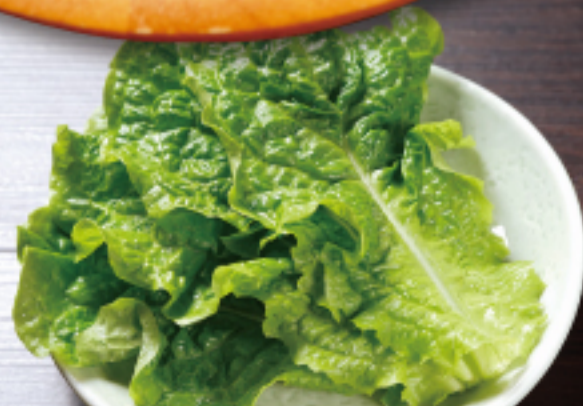
サンチュ Korean lettuce 600 円

価格はサービス料 13%と消費税 10%が含まれております。 Price subject to 13% service charge and 10% government tax.