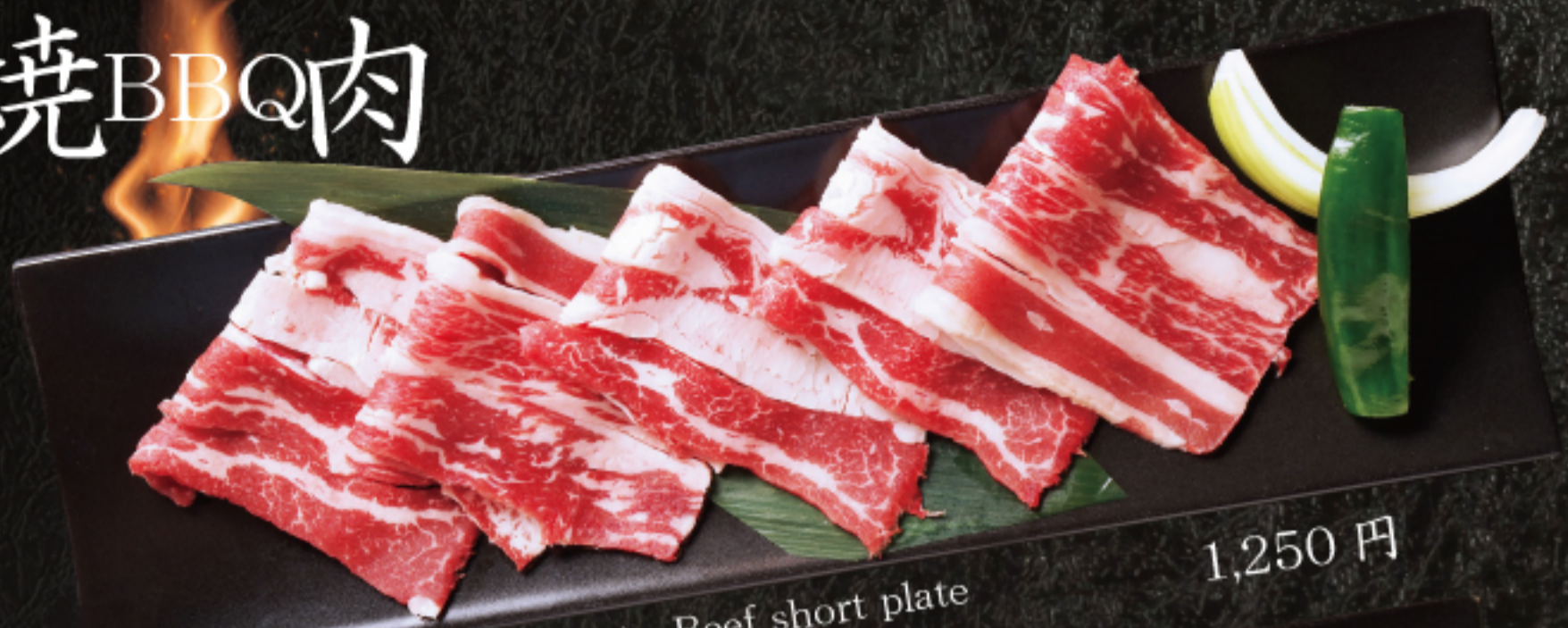
上カルビ (トモバラ) Beef short plate 1,250 円