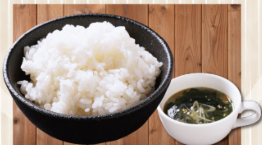
ご飯&スープセット 680 円 Soup with rice ご飯 単品 300 円 rice