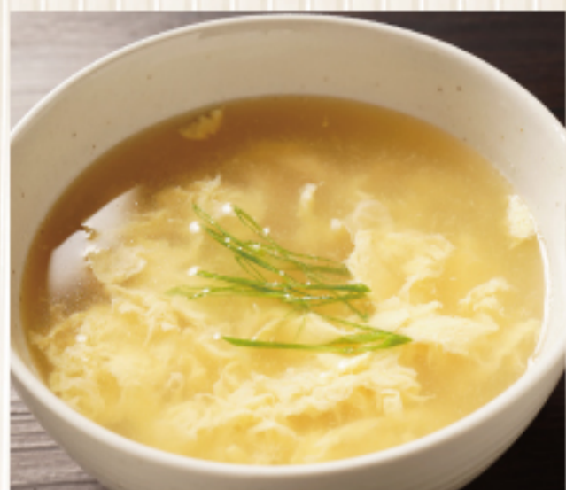
玉子スープ Egg soup