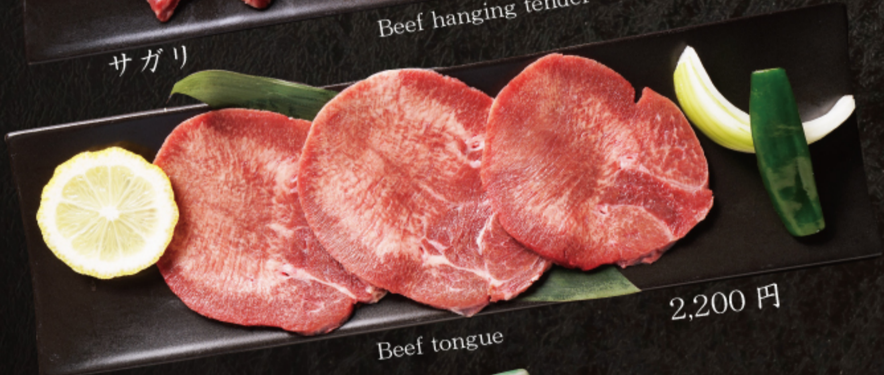
牛タン Beef tongue 2,200 円