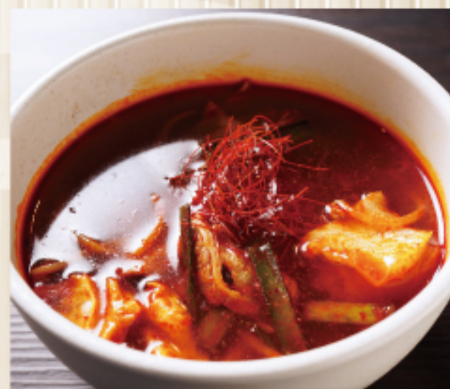
ユッケジャンスープ Yukgaejang soup