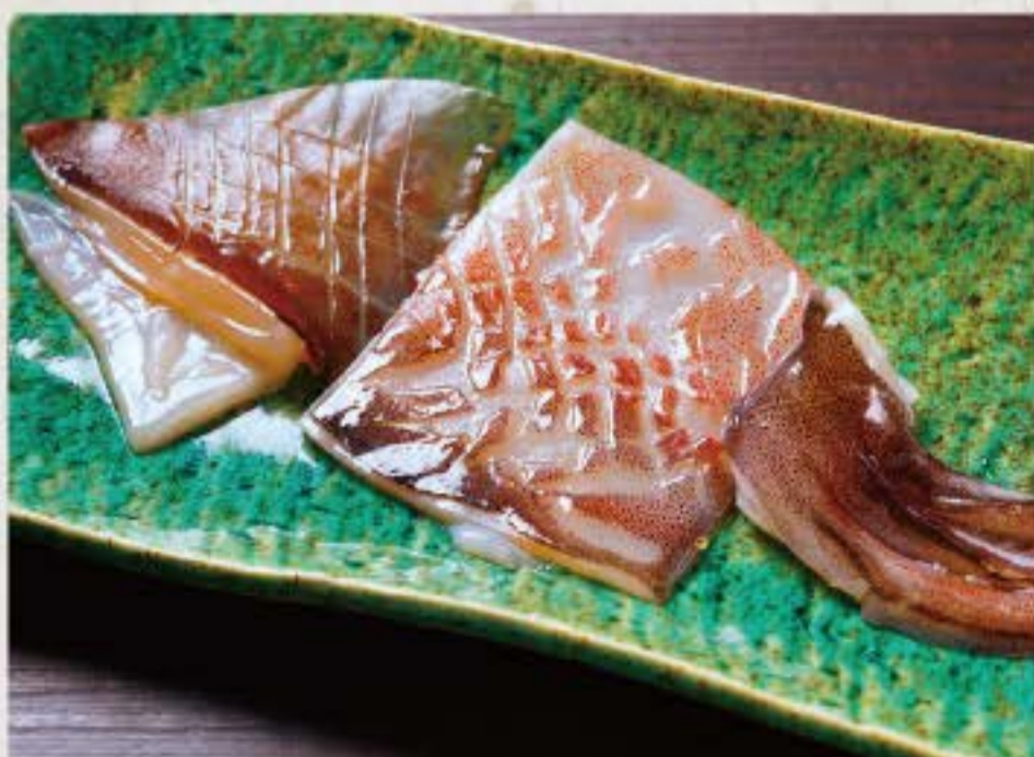
いか (半身) 800円 Squid