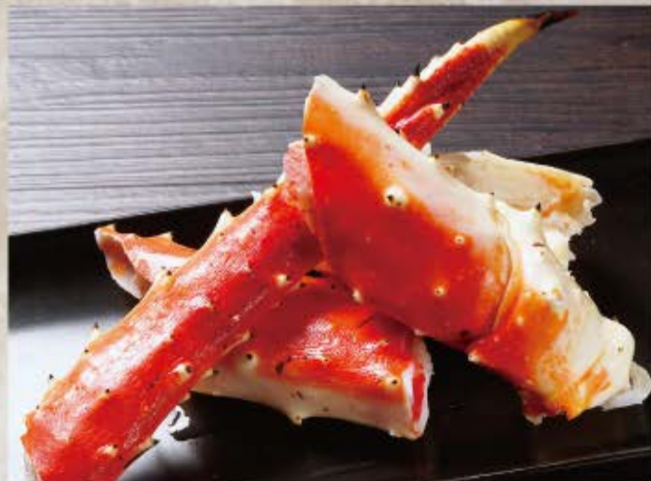
たらばがに 5,800円 King crab