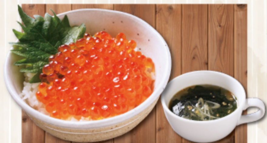
ミニいくら丼&スープセット 2,200 円 Soup with mini salmon roe bowl ミニいくら丼 単品 1,880 円 Mini salmon roe bowl