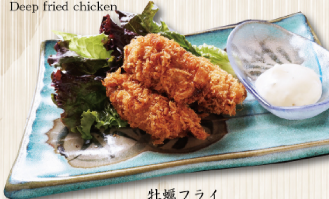
牡蠣フライ Deep fried oyster(3pieces) 【3個】 980 円