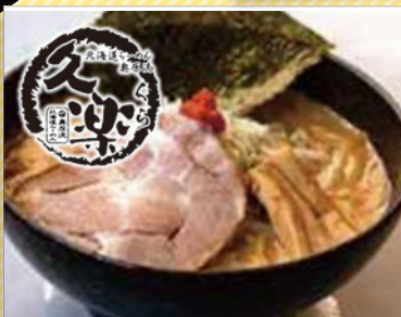
Mt カフェ&レストラン 朝里ビュー