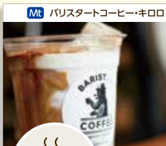
Mt バリスタートコーヒー・キロロ