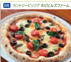
Mt カントリーピッツァ ホピヒルズファーム