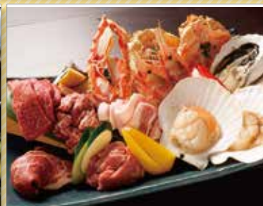
Tr 炭火焼 やん衆