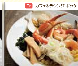
Tr カフェ&ラウンジ ポック