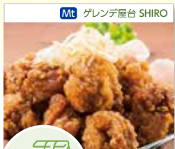
Mt ゲレンデ屋台 SHIRO

Yu ステーキ&ウイスキー Yukashi ゴージャスな雰囲気ですテーキと海鮮料理を ★