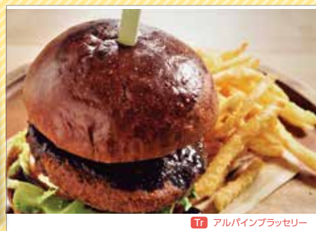
Tr アルパインブラッセリー