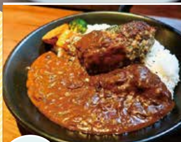
Mt レストラン クレスト