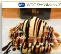
Mt WDC ワッフルショップ