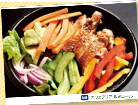
Mt カフェテリア ルミエール