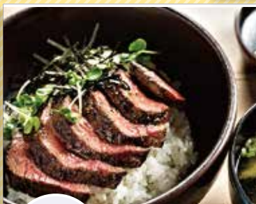
Yu ステーキ&ウイスキー Yukashi