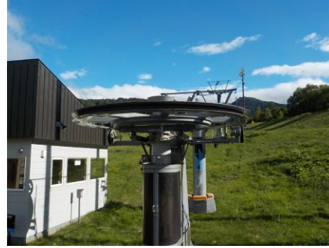
滑車ゴムライナー更新