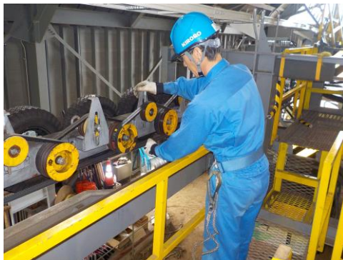
場内機械点検・整備