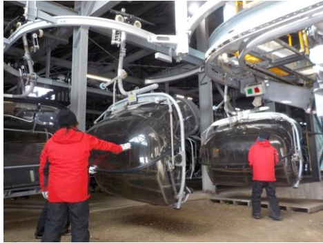
索道機器取扱い実技研修

当社では索道職員に対して、輸送及び職員やお客様への安全に役立つよう、シーズン営業開始前に施設及び機器取扱いについての安全教育を実施致しております。