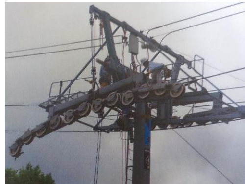
支柱索受分解整備