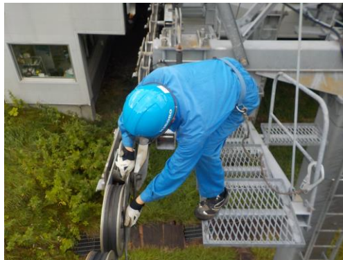
索輪溝磨耗の計測検査