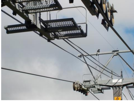
通信ケーブル更新