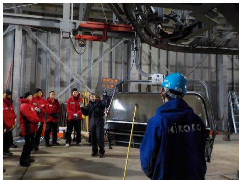
安全確認動作研修