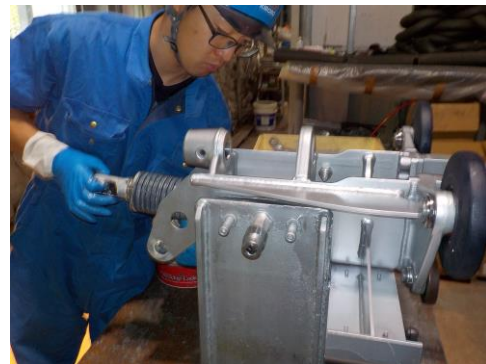
握索装置定期検査・分解整備