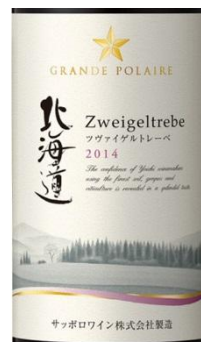
Grande Polaire Hokkaido Zweigeltrebe グランポレール 北海道 ツヴァイゲルトレーベ