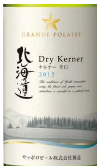
Grand Polaire Hokkaido Dry Kerner グランポレール 北海道 ケルナー辛口