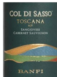
BANFI Col di Sasso