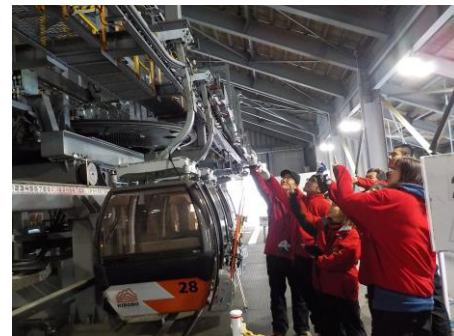
安全確認動作研修（G/L）