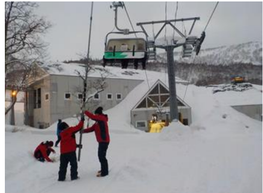
リフト乗客救助訓練