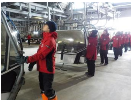
索道機器取扱い実技研修

当社では索道職員に対して、輸送及び職員やお客様への安全に役立つよう、シーズン営業開始前に施設及び機器取扱いについての安全教育を実施致しております。