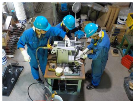
握索装置定期検査・分解整備