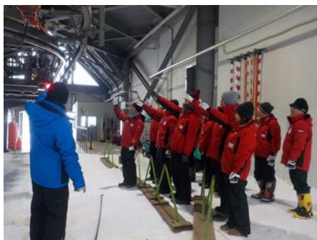
安全確認動作研修（リフト）