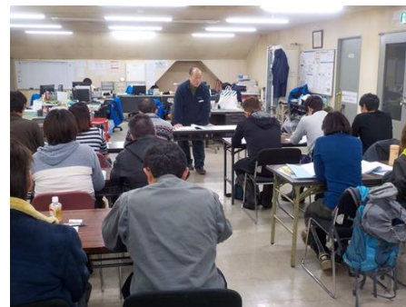
係員業務講習、安全教育（座学）