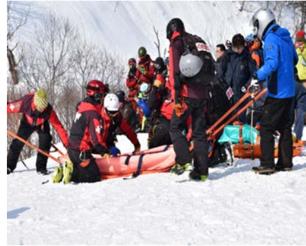
関係機関との遭難者救出合同訓練