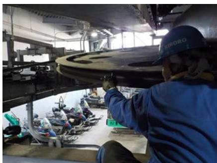
索輪溝磨耗の計測検査