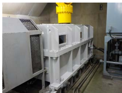
減速機の分解整備