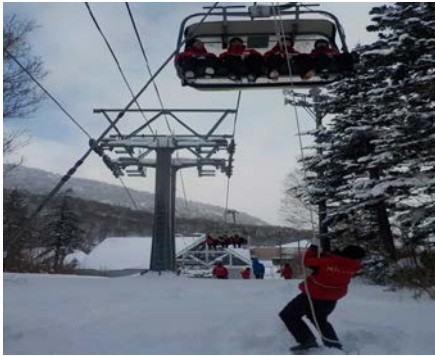
リフト乗客救助訓練

キロスノーワールドでは、毎年シーズン営業開始前に索道職員にて救助訓練を実施しております。又、シーズン中にも月1回救助訓練を実施し緊急時の対応に備えております。