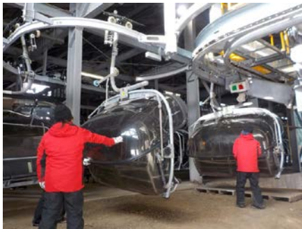
索道機器取扱い実技研修

当社では索道職員に対して、輸送及び職員やお客様への安全に役立つよう、シーズン営業開始前に施設及び機器取扱いについての安全教育を実施致しております。