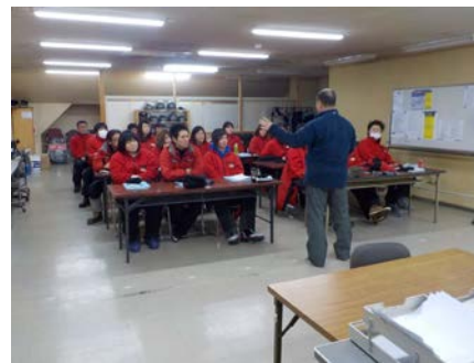
係員業務講習、安全教育（座学）