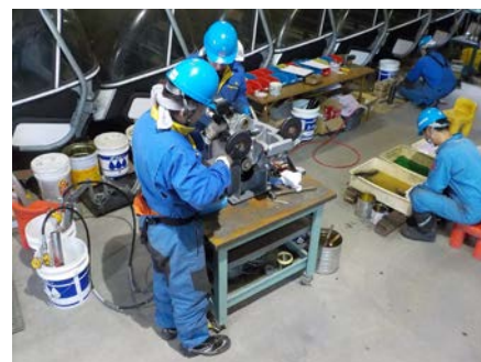
握索装置定期検査・分解整備